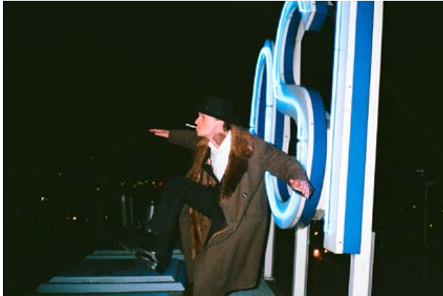
Alexander Scheer, 2015